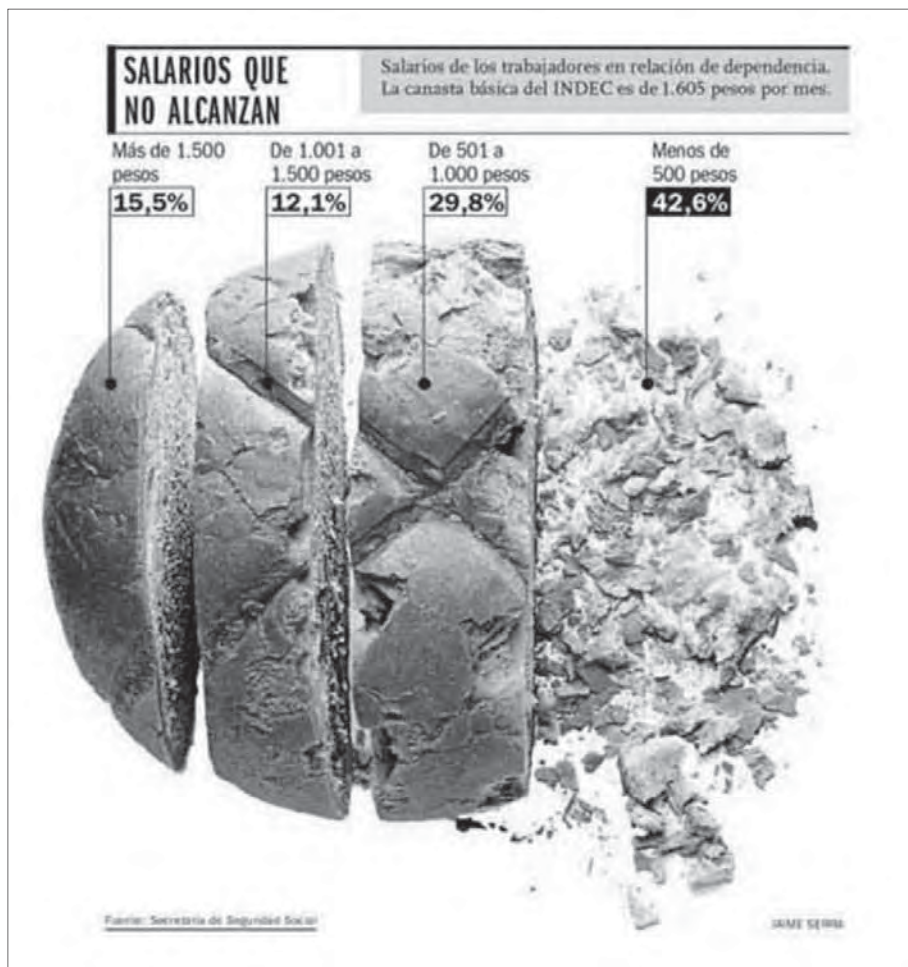
Figura 7. Infografía publicada en el diario argentino Clarín , Jaime Serra.

cuantitativa se ve reforzada por el valor numérico. Del mismo modo son respetadas las variables propuestas por De Pablos (1999) como elementos mínimos indispensables que deben estar presentes en toda infografía de prensa (título, entradilla, texto o cuerpo, fuente y firma) y recogidas también por Teixeira (2006) y López Hidalgo (2002).