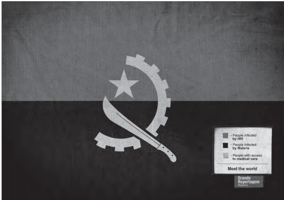
Figura 6. Parte de la campaña de publicidad de la revista Grande Reportagem elaborada por la agencia FCB Lisboa.

Ambos autores, están de acuerdo en cambio en afirmar el magnífico efecto de captación de la atención de estas gráficas y la necesidad de dar un impulso en esa línea a los diferentes trabajos que se llevan a cabo desde las secciones de infografía de los medios. En este sentido, se hace necesario recordar los que Dovifat (1959) consideraría como fines propios del periodismo y citados por Luisa Santamaría en su obra Géneros para la Persuasión en Periodismo de 1997: